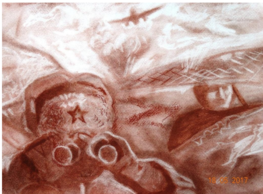
Завялова Катя, 13лет «На передовой» (сухая кисть, сангина)