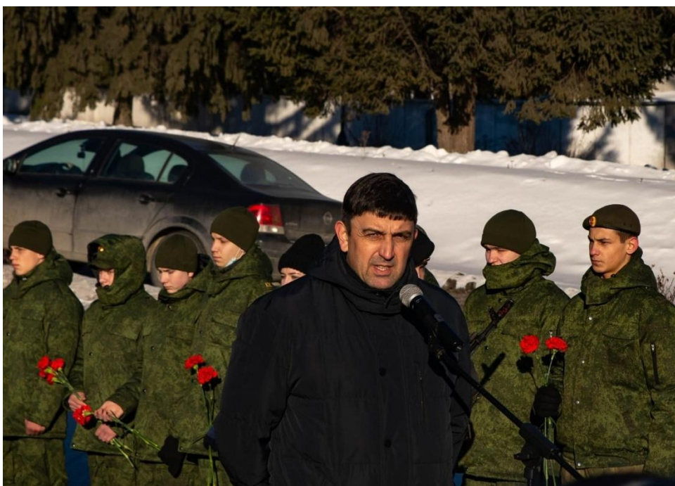
Выступает Глава Златоустовского городского округа Пекарский Максим Борисович