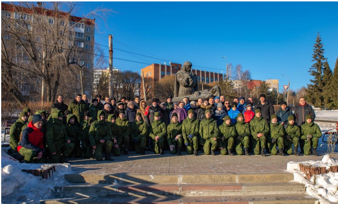
Участники акции .2021 год