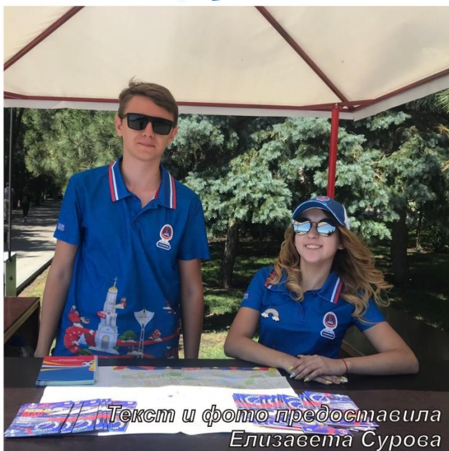
Текст и фото предоставила Елизавета Сурова