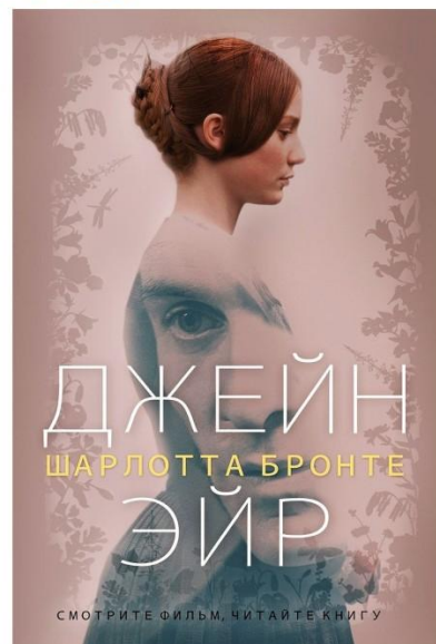
Шарлотта Бронте "Джейн Эйр"

Когда Клео, Анжелика и Садия пришли на занятия по фигурному катанию в местный ледовый дворец, тренер сразу поняла, что они могут стать чемпионками. Но для этого мало таланта, нужно приложить очень много усилий и труда. И не только изучая разбег, вращение и скольжение. Девочки узнают, что стать настоящими подругами гораздо сложнее, чем освоить идеальный прыжок!