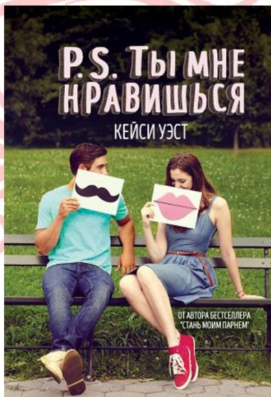
Кэйси Уэст "Ты мне нравишься"

ЛЕТО - ПОРА РОМАНТИКИ, ХОРОШЕГО НАСТРОЕНИЯ И ВЛЮБЛЕННОСТЕЙ. ПОЭТОМУ НАША РЕДАКЦИЯ РЕШИЛА СОСТАВИТЬ ДЛЯ ВАС НЕБОЛЬШОЙ ТОП КНИГ О ЛЮБИ, КОТОРЫЕ СТОИТ ПРОЧИТАТЬ.